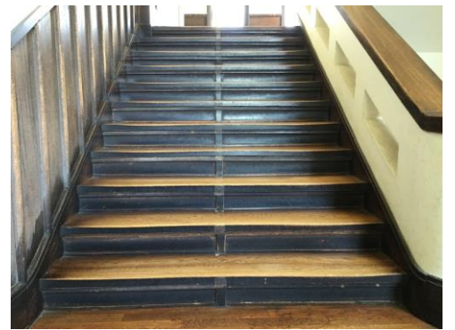
深志 80 余年間の足跡である階段

タイムスリップしたような気分になります。1 棟の外観は昭和 10 年の落成当時の趣をそのまま残していますが、実際は昭和 62 年から大