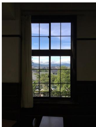
窓をよく見るとアルミサッシ

規模改修が行われて、古い鋼鉄製の開き窓は黒のアルミサッシに新調され、壁や天井も白く塗装し直し、床も全面的に張り替えられています。普通に歩いてもギシギシと音がする「 鶯張り 」の廊下だったと記憶していますが、今ではすっかり張り替え