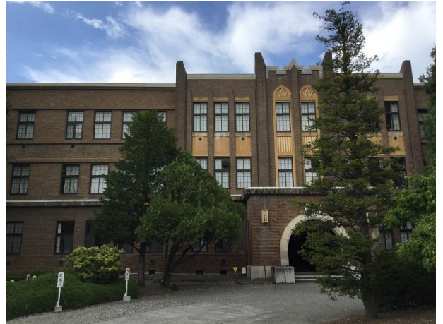
13 日の 1 棟。全ての教室のカーテンが閉じられています

「藪入り」です。この言葉、現代では落語以外ではほとんど出てきませんが、正月と盆の 16 日前後は奉公人やお嫁さんが家に帰ったり、遊びに出かけたりできる唯一の休日だった江戸時代の頃に使われていました。普段活気のある学校も、この四日間はさすがに登校する人が少なく、静寂に包まれます。多忙な日々を送る生徒や教職員ですから、せめてお盆くらいはゆっくり