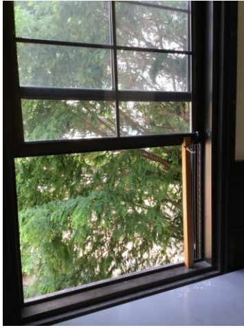
こうしないと窓が落ちてきます

において、色々な分野で、それぞれが自分を磨き、互いのことを尊重し、切磋琢磨しあう、その努力の過程にこそ、最も大事なことは詰まっている。これからも、結果にこだわりながらも、引き続きチャレンジする気持ちと地道に努力を積み重ねる姿勢を大事にしてほしい。進路希望実現の方は、これから正念場。高校生活のすべてに全力を注いでチャレンジしてきたからこそ、勉強にも全力を注ぐことができる。勉強にも一人一人のチャレンジ精神が大事で、人との比較ではなく、 自分自身へのチャレンジ 、その総和が結果として深志の力も高めていく。チャレンジ精神、チャレンジするメンタリティを大切に、深志の底力を発揮するための準備をしっかりと積み上げる、充実した夏休みにしてほしい。」という