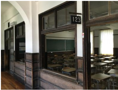
はずされた廊下側の窓 (1棟)

とんぼ祭が終わってから、連日異常な猛暑が続いています。深志高校は教室にクーラーがありませんので、天井据え付けの扇風機で何とか凌いできましたが、今年の暑さはちょっと凌ぎきれません。危険な暑さ、という表現が一般的に使われていますが、こまめな水分補給等、体調管理に気を付けていないと命にかかわる問題になりかねません。LL教室、自習室、図書館にクーラーがcaろうじてありますので、休み時間等に開放して クール