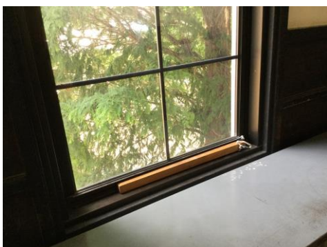
1棟の廊下の窓には謎の木片が必ず1本