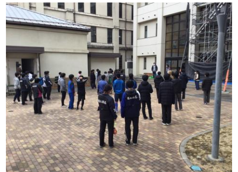
中庭で委員長の説明を聞く厚生委員たち

学年末考査最終日の午後、第 3 回の校内ワックスがけと 1 棟の油敷きが行われました。ワックスがけの対象は 2・3 棟特別教室と 2 棟 2 階の各 HR 教室、油敷きは 1 棟の全教室・研究室と廊下・階段。HR 教室はクラスの生徒がワックスがけを行い、その他は