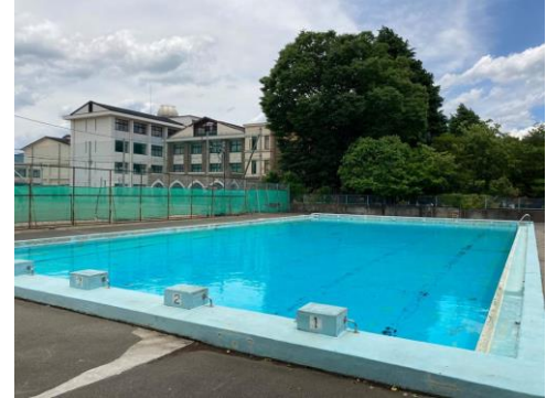
6月15日、プールが満水になりました。

県が定めている「県立学校再開ガイドライン」が改訂され、先週から適用となりました。主な変更点は、○熱中症回避のために、授業中に教員もフェースシールドは使用せずマスク着用のみとする。○教室の室温が上がり、熱中症の発生が懸念される場合は、生徒がマスクを着用しないことも可とする。ただしその場合も、発言する際はマスクを着用するとともに、十分な換気に配慮する。○文化祭は一般公開、物品販売等については、当面の間、実施を見合わせる事としていたが、実施する場合は、人数制限や販売物の種類などを慎重に検討する。○部活動は段階的に通常の活動