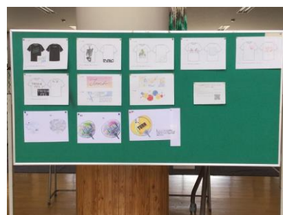
投票前の候補一覧、決定は次号で。

です。先週の水曜日には、とんぼ祭のTシャツやうちわ、タオルのデザインが決まりました。深志生の知恵と工夫の総結集を期待します。