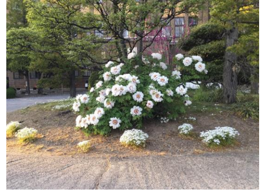
玄関前の牡丹、天然色の季節到来ですが……

県教育委員会から、4月30日付けで、県立学校の一斉休業を5月10日まで延長するとの指示がありました。ただし、これは暫定的な措置であって、今後の県立学校での休業の必要性については、国における緊急事態宣言の延長または解除の動向、県の専門家懇談会の提言等を踏まえ、この大型連休中に判断することになっています。さらに伸びる可能性が大ということでしょう。とりあえず延長された期間の学習については、7・8日の時間割や学習内容が各学年特設ホームページに掲載されていますので、確認してください。遠隔会議システム（Zoom）によるオンライン授業、YouTubeによる授業動画配信、紙ベースの教材や課題、この三つのツールを自宅での学習支援として更に充実させていきますので、うまく組み合わせて、自分なりの効果的な方法を見つけて学びを確実に進めてください。この休業期間中の自学自習で取り組んだ範囲は、学校が再開された際には、授業の中では扱わないようにしたいと考えています。そのために、オンライン授業での出欠確認や動画配信の視聴確認、課題やプリント類の提出など、今後一定の負荷をかけていくことになると思いますので、気持ちと身体の準備をしておいてください。詳しくは、大型連休明けに改めてお知らせします。なお、連休中も一部の教科でオンライン授業や動画配信がありますので、見逃がすことがないように。毎日HPを見るようにお願いします。