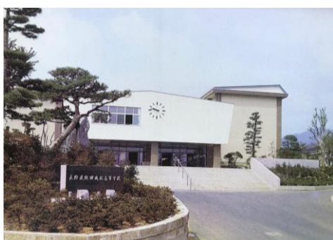
④ 移転当初の正門付近(昭和51年頃) (創立80周年記念の門扉はまだない)