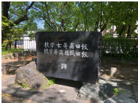
① 風越高校旧校地跡 記念碑 (現在の飯田創造館正面付近にあります)

文章の中に、「あしたにこの山を仰ぎ登校、夕べに仰いで帰る風越山」とありましたが、いま、多くの皆さんが「大根坂」と呼んでいる坂は、野菜の「大根」ではなく、本来は「代魂」と表記されていました。これは、山岳信仰(白山信仰)に基づいて、山を神として信仰していた人たちが、のぼりおりしていた道をそう名づけたと考えられます。「足が太くなるから大根坂」ではなく、歴史的な信仰に基づく意味であることもおぼえておいてください。