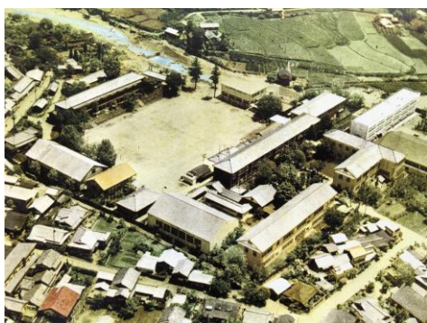
③ 旧校地・校舎(小伝馬町) S37 撮影