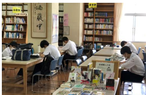
図書館で勉強に打ち込む3年生