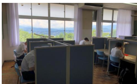
進路学習室で勉強に打ち込む3年生