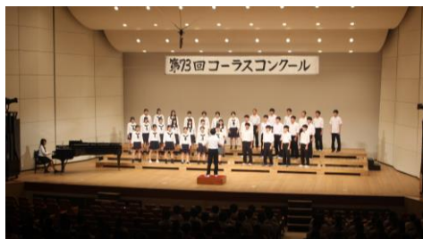
コーラスコンクール 最優秀賞 3年1組