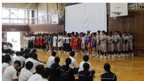
高体連選手壮行会(5/23)