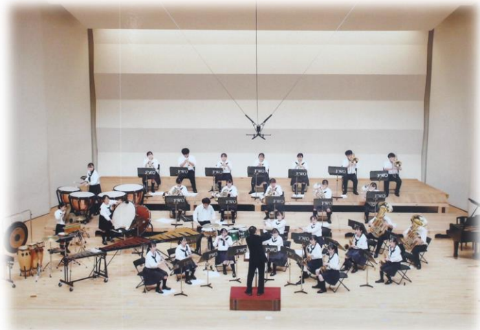
「白墨の輪へのオマージュ〜グルシェの愛〜」を演奏。

本校吹奏楽部は8月28日（日）豊田市民文化会館（愛知県豊田市）で開催された、第77回東海吹奏楽コンクールに長野県代表として出場しました。7月31日の中南信大会、8月7日の県大会とも1位、金賞を獲得し、県大会では満点（50点）を達成しました。東海大会出場は20年ぶり。B編成（30人以下の部門）の最上位大会でもある東海大会への出場は初となりました。