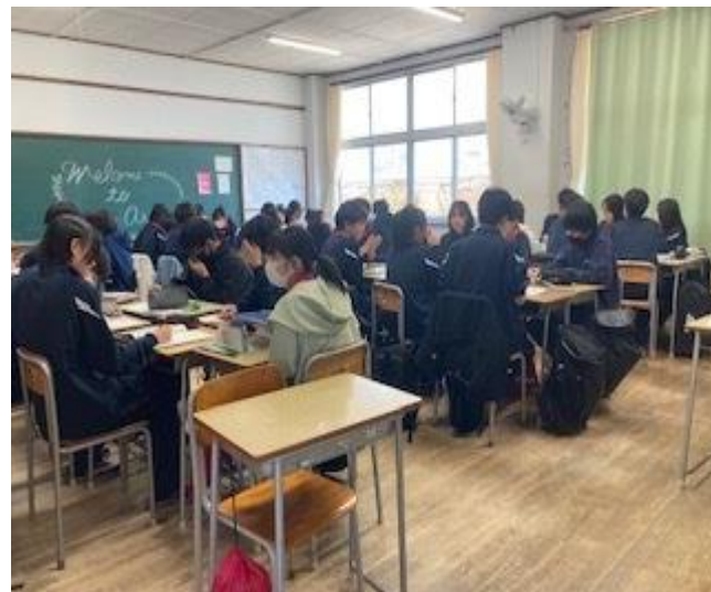
協働的な学びも積極的に実施(1年 保健)