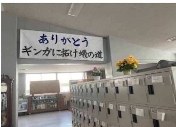
昼食風景。1年生が場所取り。↓生徒会スローガン