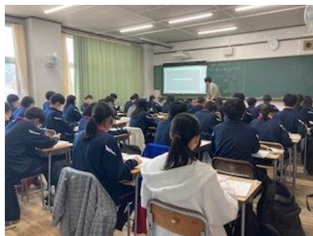
スピード感ある高校の授業！一生懸命に取り組む姿は、さすが蟻高生！(1年 英語)