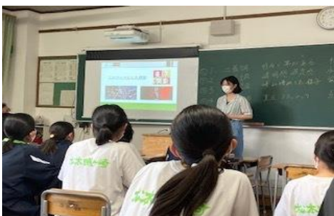
「音楽が人にもたらす力」「社会暗記科目にしない方法とは」「登園時に子供はなぜなくのか」「1つの曲を移調した時の印象の違い」等