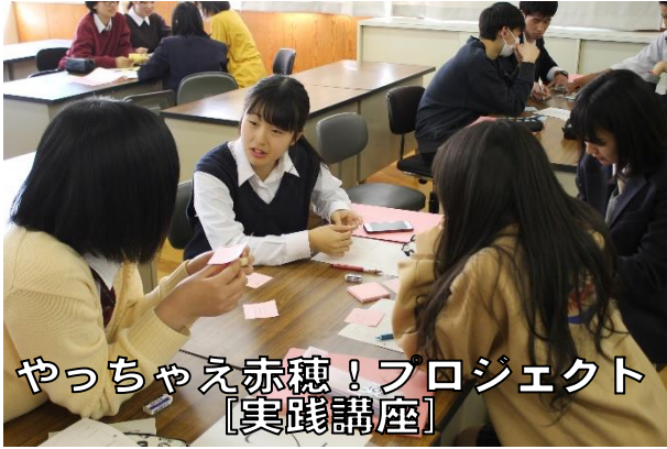
やっちゃんえ赤穂！プロジェクト 【実践講座】