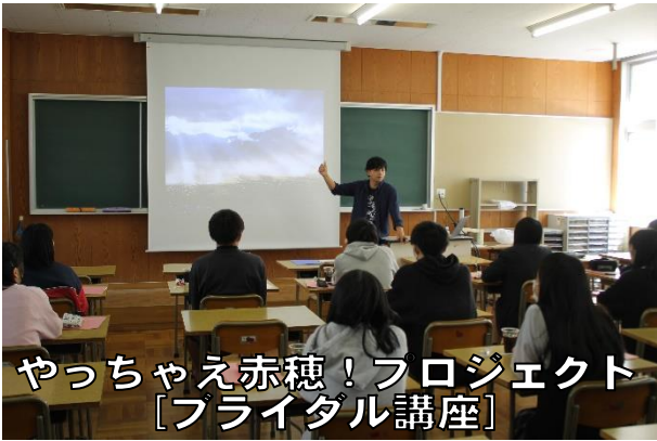
やっちゃんえ赤穂！プロジェクト 【フライダル講座】