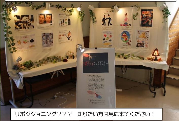
リポジショニング??? 知りたい方は見に来てください!