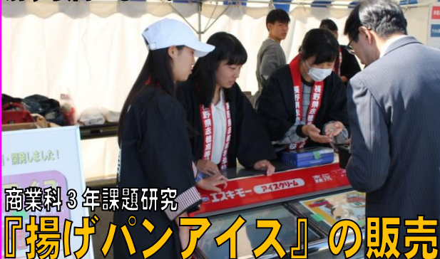
商業科3年課題研究 『揚げパンアイス』の販売