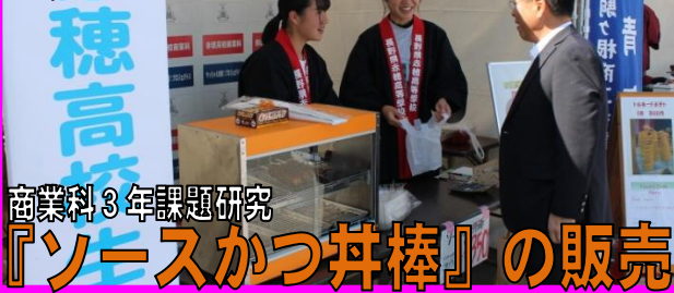
商業科3年課題研究 『ソースかつ丼棒』の販売