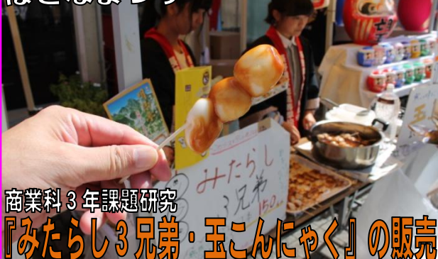
商業科3年課題研究 『みたらし3兄弟・玉こんにゃく』の販売