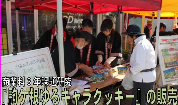
商業科3年課題研究 『もちもちキャラクッキー』の販売