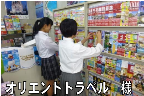
オリエントトラベル 様