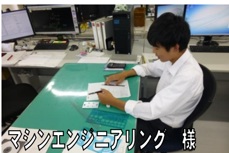
マシンエンジニアリング 様