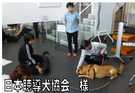
日本聴導犬協会 様