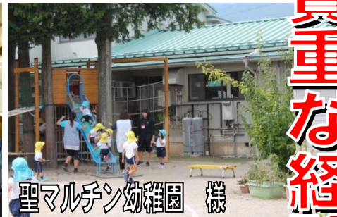
聖マルチン幼稚園 様