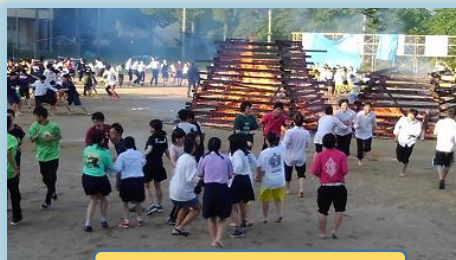
ファイヤーストーム