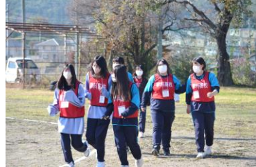
グラウンドを1周してから町内のコースへ