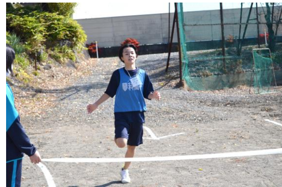
今年度 第1位、8kmを34分台でした。