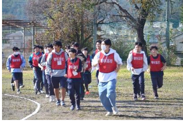
3年生は最後の強歩大会