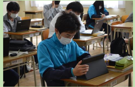
(写真は6月9日 1学年「プログレス」の様子) 本校では国・数・英の3教科で苦手な単元まで戻って学び直したり、得意な単元はどんどん先に進むことができる教科、プログレスを設置しています。今年度の1年生は1人1台タブレット端末で、学習アプリ「すらら」を活用していきます。