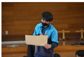
(5月29日 3学年 LHR 立科小学校、立科中学校との交流行事) 台風の接近に伴う雨で笠取峠の松並木での三校清掃が中止になりましたが、代わって小学生、中学生の皆さんと松並木や立科町の未来について話し合い、発表しました。