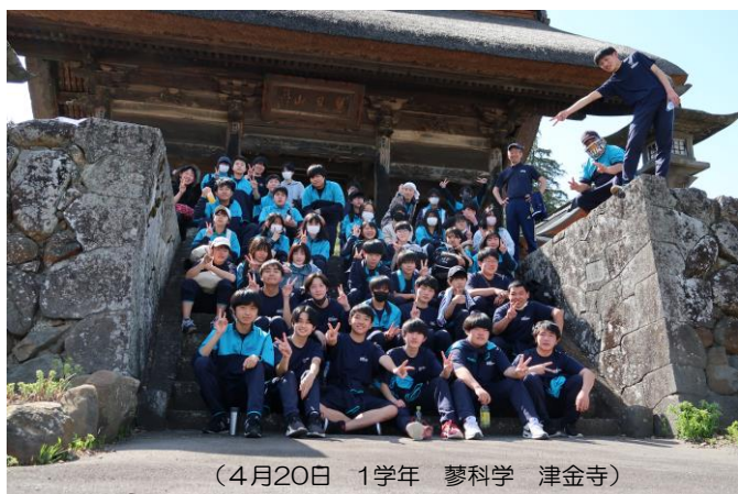
(4月20日 1学年 蓼科学 津金寺)