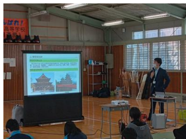
(5月11日 1学年 蓼科学 立科町出前講座)