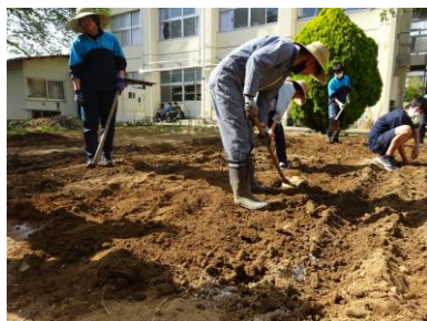
(4月28日 2学年 蓼科学)