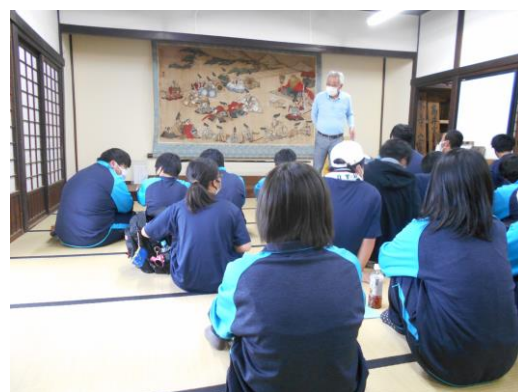
(5月17日 1学年 蓼科学 芦田宿本陣) わかりやすく客観的な資料とともに説明を受けました。芦田宿や宿場そのもののしきみを学ぶことができました。