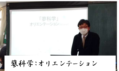
蓼科学:オリエンテーション