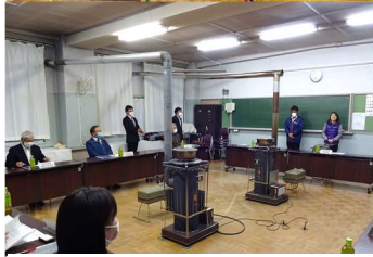
創立100年当時の生徒会役員来校