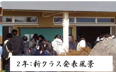
2年:新クラス発表風景