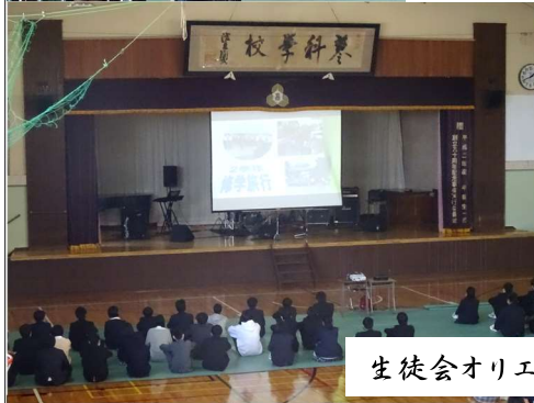
生徒会オリエンテーション