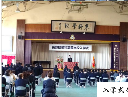
入学式と新クラス