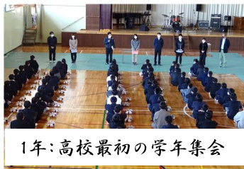
1年:高校最初の学年集会