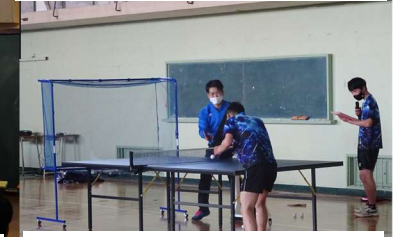
部活紹介:総合運動部・卓球