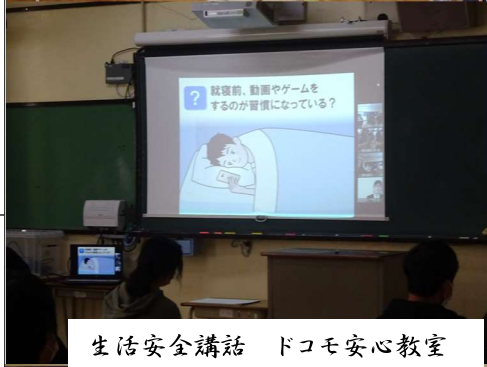
生活安全講話 ドコモ安心教室