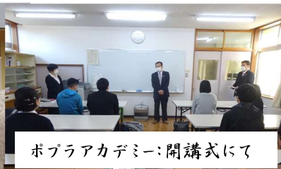
ポプラアカデミー:開講式にて