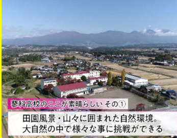
夢科高校のこころが素晴らしいその①

全編再生、4部分再生があります。右側のQRコード、または、HP>中学生の皆さん>学校調べナビ で、ぜひご覧ください。