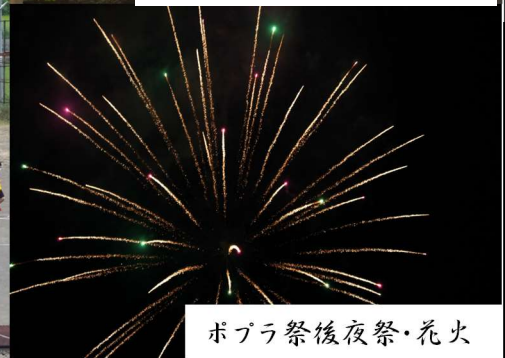
ポプラ祭後夜祭・花火