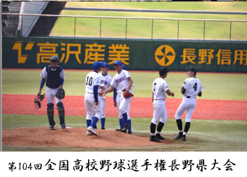
第104回全国高校野球選手権長野県大会