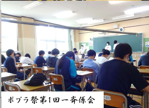
ポプラ祭第1回一斉係会