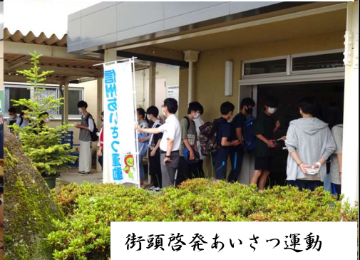
街頭啓発あいさつ運動