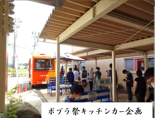
ポプラ祭キッチンカー企画