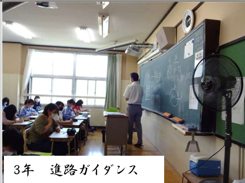
3年 進路ガイダンス