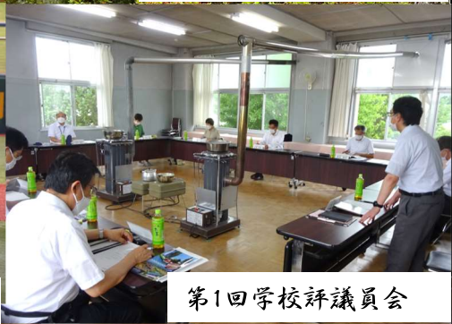
第1回学校評議員会