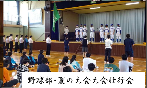
野球部・夏の大会大会壮行会