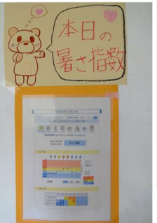
保健委員会刊 熱中症対策→