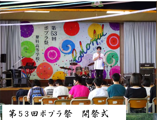
第53回ポプラ祭 開祭式