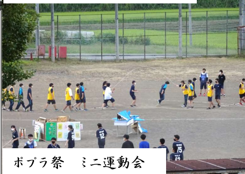
ポプラ祭 ミニ運動会