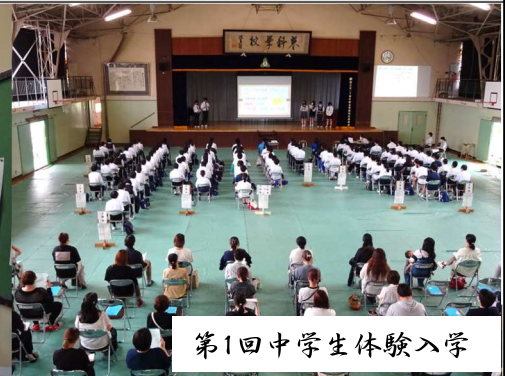
第1回中学生体験入学