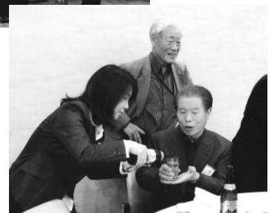
先輩よろしくお願ひします