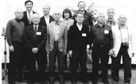
須坂商業高校東京同窓会総会