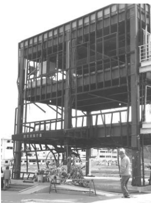
取り壊しが決まった宮城県南三陸町、防災センター

東京同窓会とは、東京で単身赴任をしていた八年間のお付き合いです。楽しい思い出を沢山頂きました。併せてお礼申し上げます。