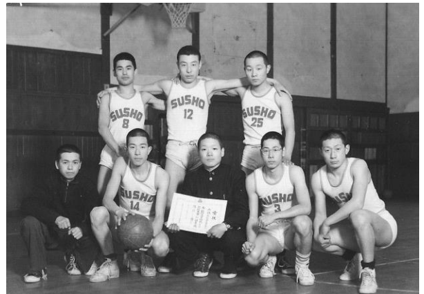
S32籠球部県大会入賞記念 2年生のとき、前列中央が私

しかし、私は今須商が閉校となる事で「心の心棒」が何処かに行ってしまう寂しさを感じています。