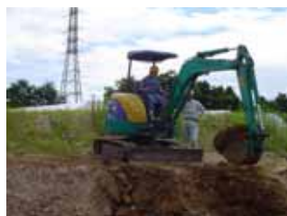
フォークリフト講習(7/28~29)