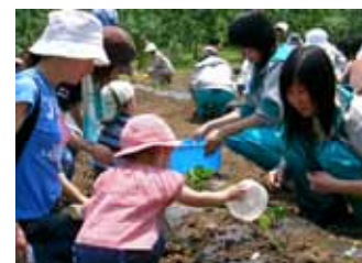
さつまいも交流会