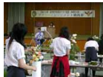
フラワーアレンジメント県大会