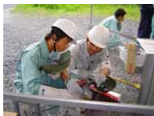
アーク溶接講習会(7/8~9)