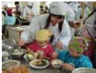
食育サークル交流会