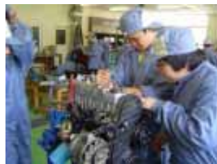
エンジンの分解実習