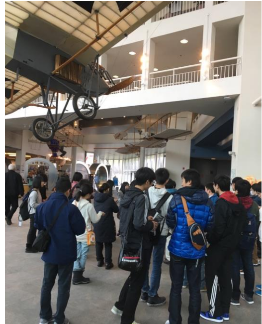
左上、右上、中右はボーイング社エベレット工場のfuture of flightにて、中左はマイクロソフト本社前