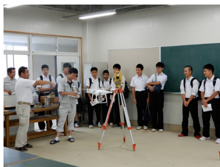
土木建築(光波で測量の実演)