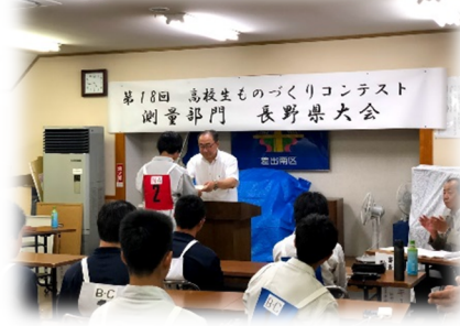
長野県大会で、表彰される様子