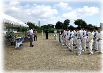
長野県大会の開会式の様子

8月3日に、高校生が測量の技術を競う大会がありました。今年からルールが変わり、3人が測定、3人で計算の総合点の結果を競うものとなり、本校から2チームが出場し、Aチームが3位入賞、Bチームが5位、という結果でした。