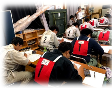
長野県大会における測量の内業(外業の測定データを計算)の様子