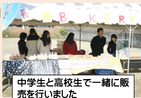
中学生と高校生と一緒に販売を行いました