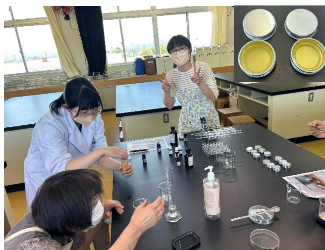
図3 アロマクリームの作製