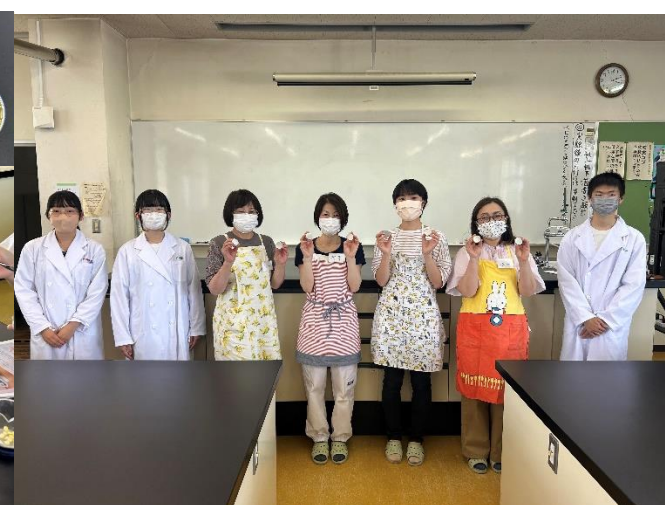
図4 受講者の方と記念撮影