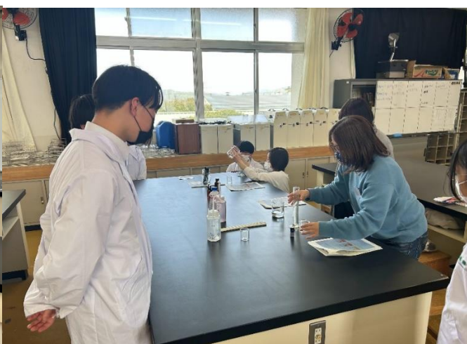
図2 アロマスプレー作製