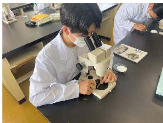
双眼実体顕微鏡を見ながら摘出