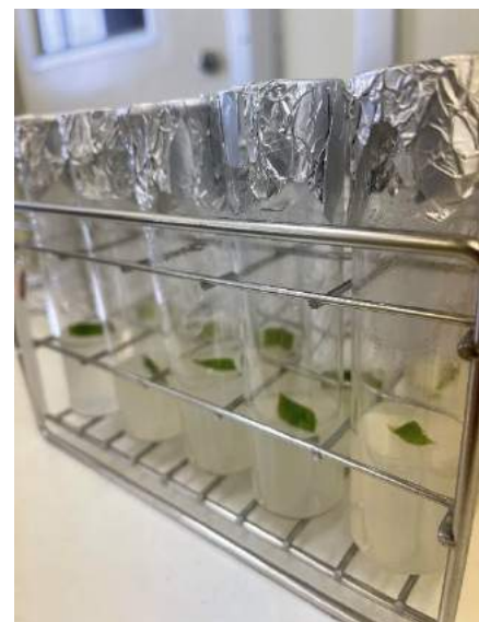
培地に置かれた葉片