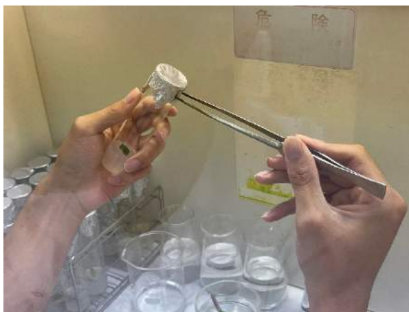
ピンセットで細かい作業