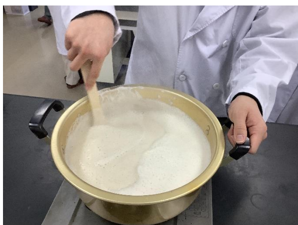
鍋に磨砕した「呉」を移し、10分間加熱します。