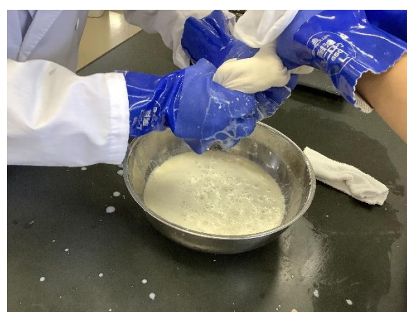
呉をこし袋に入れ、豆乳を絞ります。