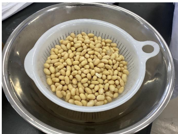
一昼夜水に浸した大豆を使います。

概 要 豆類の加工品の一つとして木綿豆腐の製造実習を実施しました。大豆は栄養価の高いタンパク質を豊富に含むため「畑の肉」とも言われます。豆腐は、大豆に水を加えて取り出したタンパク質を主とした成分を「にがり」などの凝固剤でかためて作る食品です。グループに分かれて製造しましたが、それぞれの班により個性的な豆腐ができました。