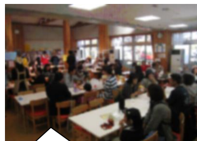
食堂：大人気の特製カレー 二日目のみの販売でした