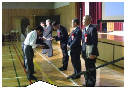
工事業者の皆様へ感謝状の贈呈

ご協力いただいた関係者の皆さま全てに感謝したいと思います。ありがとうございました。