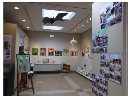
造形展会場：天井から下がるコウモリやマンボウも…

・「生きてるなあ」と感じさせる作品ばかりですね。とても温かい気持ちになりました。ありがとうございます。(小布施町 50代)