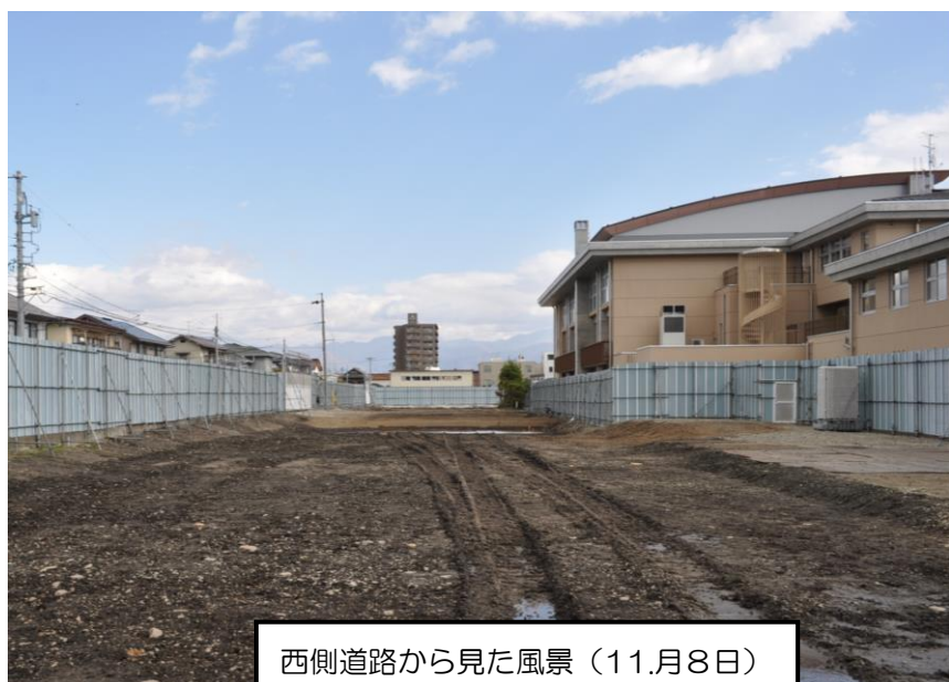
西側道路から見た風景(11月8日)