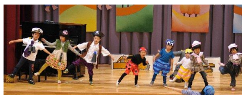
音楽会：幼稚部の発表