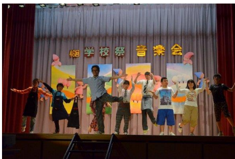
ファッションショー～開催式

校舎改築工事のため、当日駐車場をお借りする等、近隣の皆様方にはたいへんご協力いただきました。心より感謝いたします。