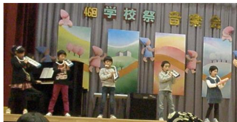
音楽会：小学部 1・2 年生の合奏