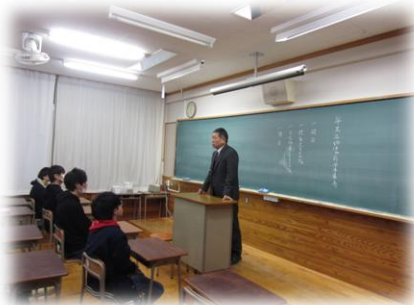
昨年 12 月 25 日、年末年始休業前に全体集会を行いました。

今年度も残り 3 ヶ月を切りました。寒い日は続きますが、卒業・進級に向け、みんなで頑張ろう。