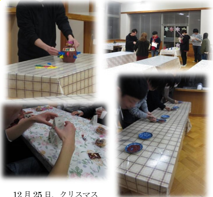
12 月 25 日、クリスマス会を開催しました。会の中では先ず、過日行ったボウリング大会の表彰を行い、続いて、正副会長の進行によるゲームで、楽しい和やかな時間を過ごしました。