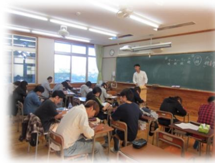
それぞれの学年の授業の様子