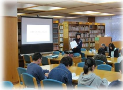
図書館オリエンテーション（1年生）