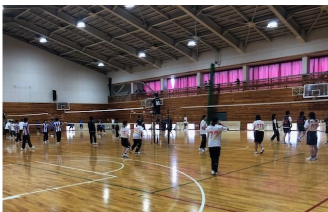
春季クラスマッチの様子