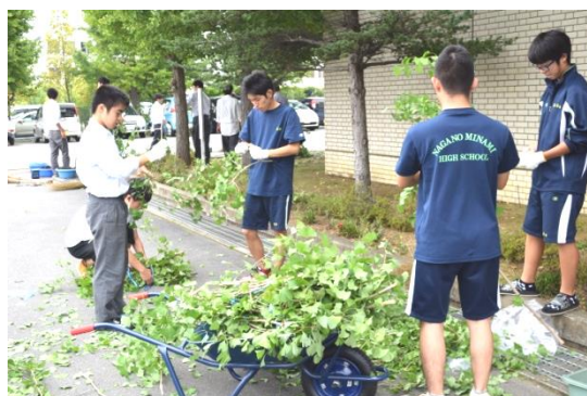
【銀杏の枝おろし作業】