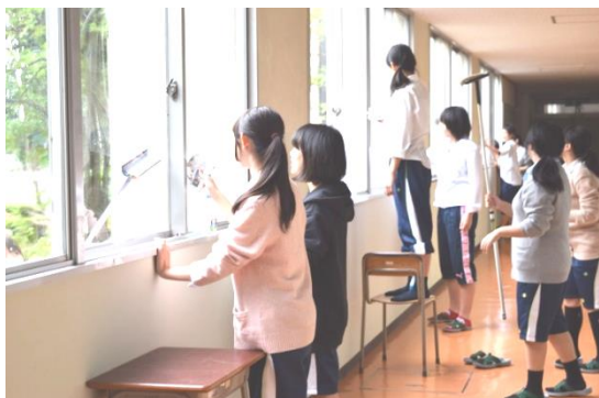
【窓ふき作業】 1階をメインに