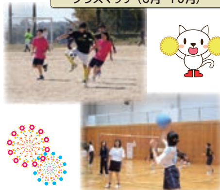
クラスマッチ (6月・10月)