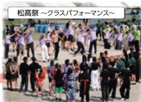
松高祭 ～クラスパフォーマンス～