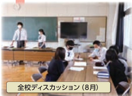
全校ディスカッション (8月)