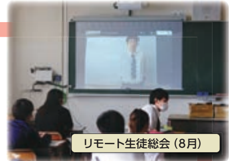
リモート生徒総会 (8月)

第36期生徒会テーマ【創造から実現へ】 委員会活動だけでなく「スマホールール活動」「花植活動」「全校ディスカッション」にも力を入れています。