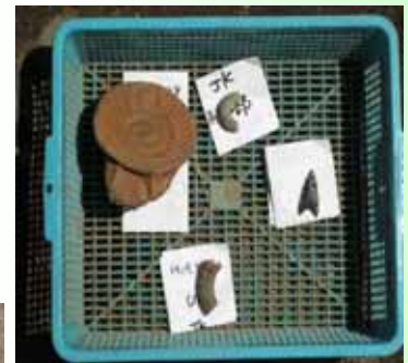
発掘途中の縄文土器

この発掘調査が終了するといよいよ来るべき多部制・単位制高校のスタートに向けて本格的な新校舎の建設工事が始まります。新校舎の完成は平成21年8月の予定となっています。