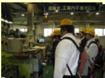
産業視察で工場見学をする生徒

5月を迎え、3年生の進路に向けた活動がいよいよ本格的に始まりました。5月29日（火）には上伊那職業安定協会主催の産業視察が実施され、5月31日（木）には、校外から講師の先生をお迎えして進学者・就職者向けに進路ガイダンスがおこなわれました。