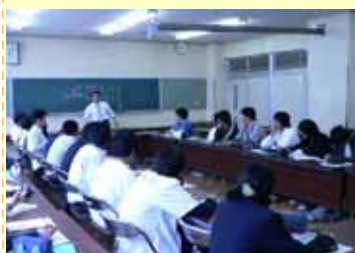
真剣に講師の先生の話聞く

5月を迎え、3年生の進路に向けた活動がいよいよ本格的に始まりました。5月29日（火）には上伊那職業安定協会主催の産業視察が実施され、5月31日（木）には、校外から講師の先生をお迎えして進学者・就職者向けに進路ガイダンスがおこなわれました。