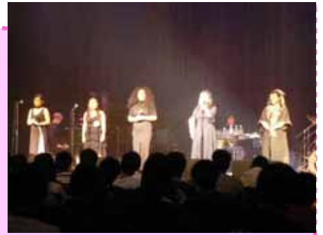
迫力ある歌声が会場に響きました

6月4日、箕輪町文化センターを会場に、芸術鑑賞会がおこなわれました。今年は5人の女性グループ[CoCoRo*Co](ココロ・コ)によるゴスペルを鑑賞しました。ゴスペルのテーマは、大地・宇宙・人類・地球すべてに対する感謝と愛です。ステージでは透明感あふれる歌声と心地よいテンポの中で生徒全員も一緒にハーモニーを奏でる場面もあり、あっという間の90分でした。