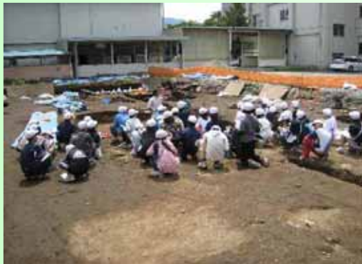
遺跡を見学する箕輪中部小学校の皆さん

先月から新校舎の建設予定地で、工事に先立ち、遺跡の発掘調査が始まりました。発掘では、縄文土器のほか、矢じり、穴のあいたまが玉（耳飾り）などが出土しています。（右の写真）