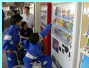
どうすれば買いやすいかな？

自販機でジュースを買ったり、段差を越えたり、狭い場所を歩いたり、日常的な動作も行動を制限されるとなかなか思うようにいきません。生徒たちはとまどいながらも、障害者の立場で考えることや、介助の技術などを学びました。