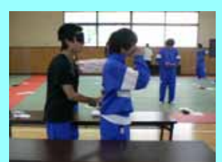
介助者の引いてくれる手が頼り