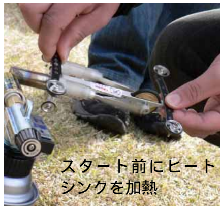
スタート前にヒートシンクを加熱