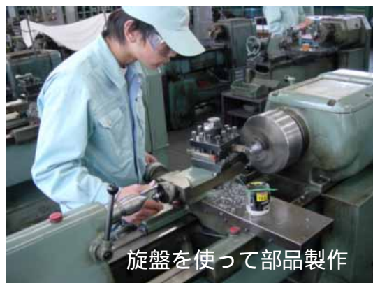
旋盤を使って部品製作