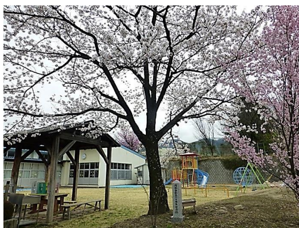
平成30年度母校入学式と満開の桜