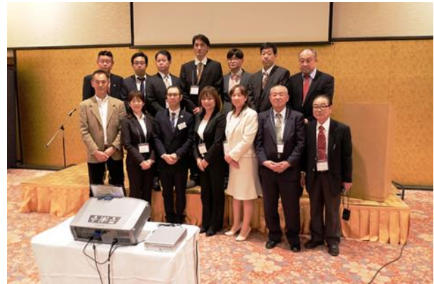
関東・北信越ほかの同窓会長との記念写真