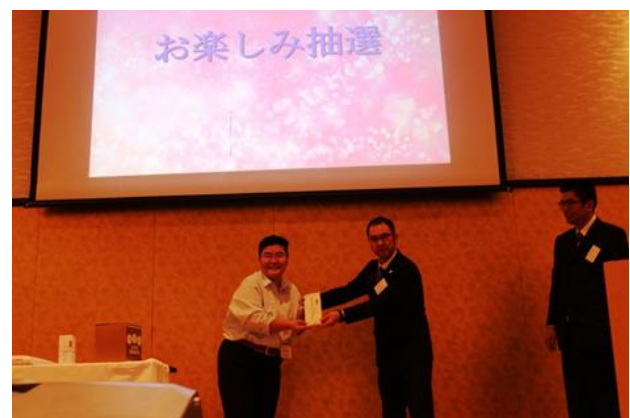
お楽しみ抽選“当たった賞品だった”