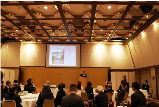
記念祝賀会（内田会長の挨拶）