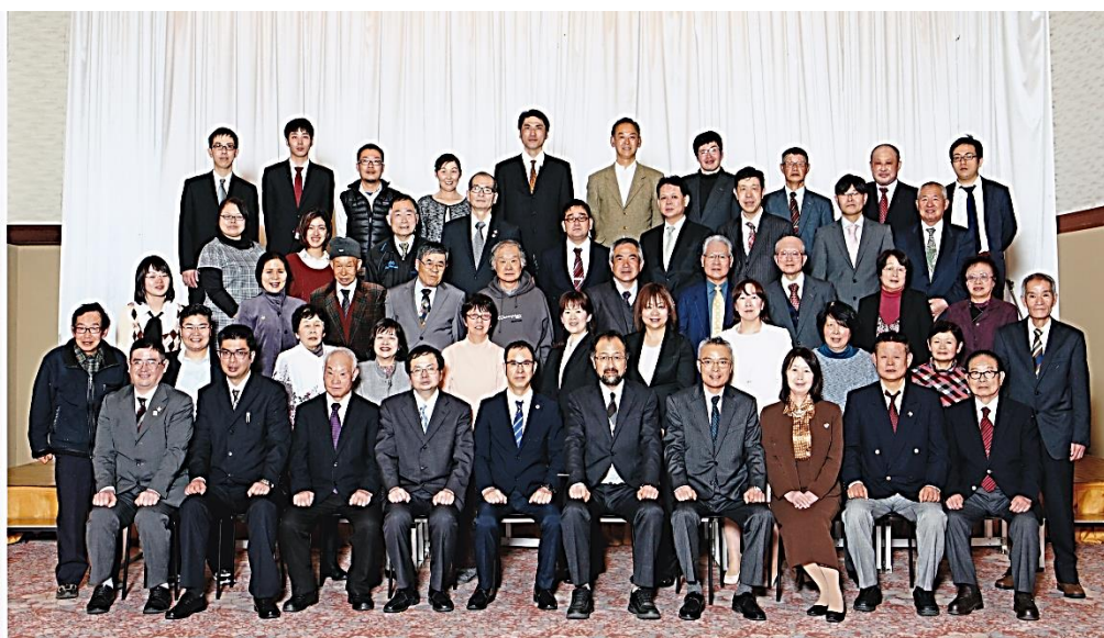
長野県松本ろう学校同窓会創立75周年記念大会 平成28年3月19日（土） 於 塩尻市ホテル中村屋