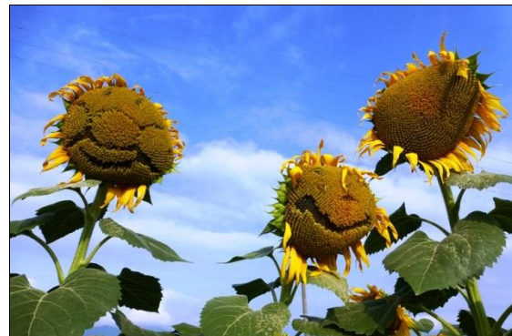
道の駅ほりがねの里・ひまわり畑（安曇野市堀金）