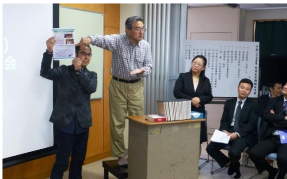
筑波大学附属聾学校同窓会の定期総会

その折、私が「附属聾学校同窓会北信越支部設立式典 in 長野」のPRをした結果、ご承認を頂くことができました。（内田記）