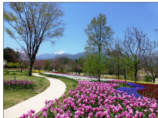
常念道祖神と国営アルプスあづみの公園 (安曇野市堀金)