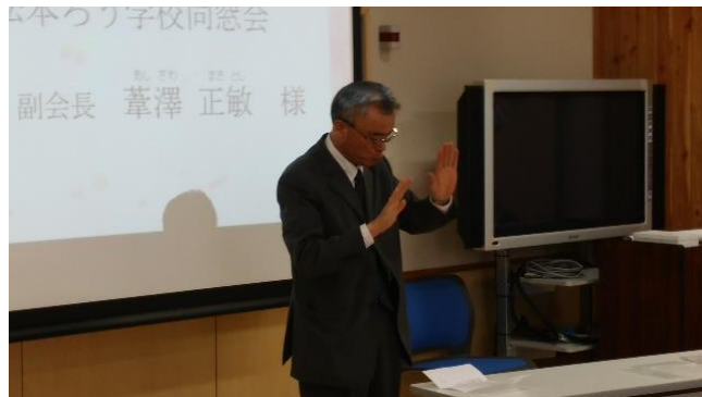
長野ろう学校同窓会の定期総会