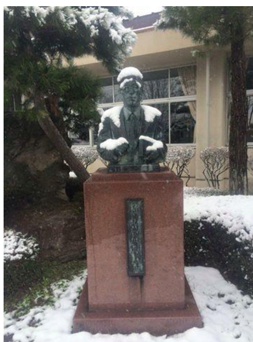
雪桜と小岩井先生胸像の景色（2015/4/8）