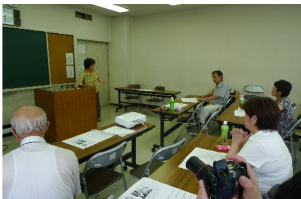
定期総会にて活動報告、会計決算報告