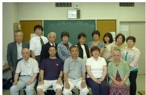
定期総会終了後、記念写真