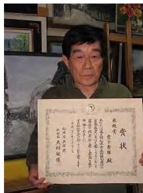
油彩「カンポデ・クリプターナー」 ★準グランプリ<<無逢賞>>★

《ひとこと》 第1回、第2回公募展は締切が間に合わないため、出品しませんでした。今年の第3回公募展に出品しても入選だろうと思っていました。入賞(2位賞)通知が届いてびっくりしてしまい、大変嬉しい限りです。私は油絵制作が大好きですので、今度レベルの高い公募展での“最高賞”を目指して頑張りたいと思います。ご声援を頂き、ありがとうございました。