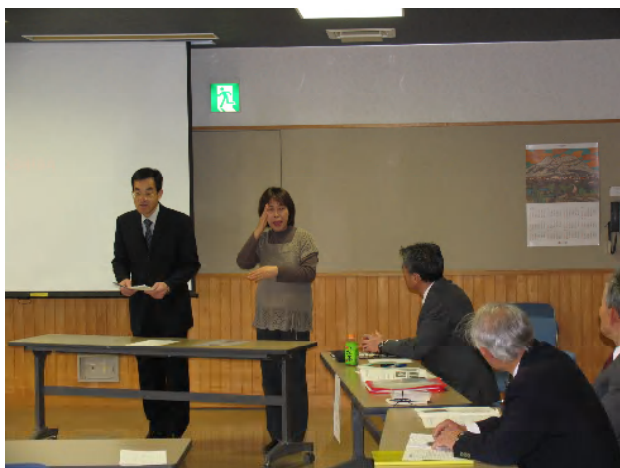
望月弘教頭先生よりご祝辞