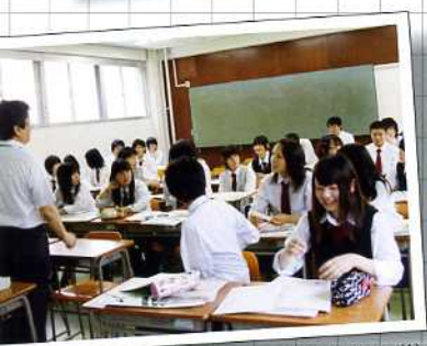
大学見学(県短期大学)