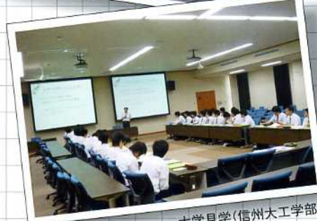
大学見学(信州大工学部)