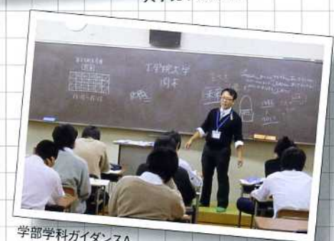
学部学科ガイダンスA