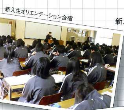
新入生オリエンテーション合宿