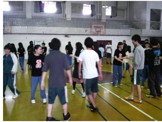
体育の授業交流（ダンス）