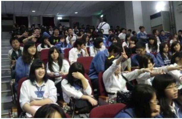
ホールでのセレモニー