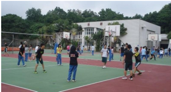
体育の授業交流（バレーボール）