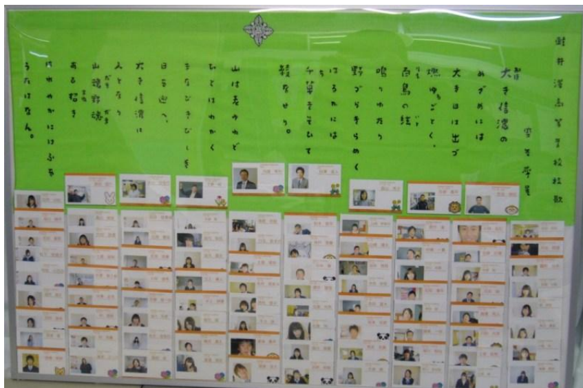
生徒たちが贈ったプレゼント

軽井沢高校創設60周年記念事業でつくられた校歌歌詞入りの日本手ぬぐいと先生方と生徒の写真入りの名刺をいれたものを贈りました。