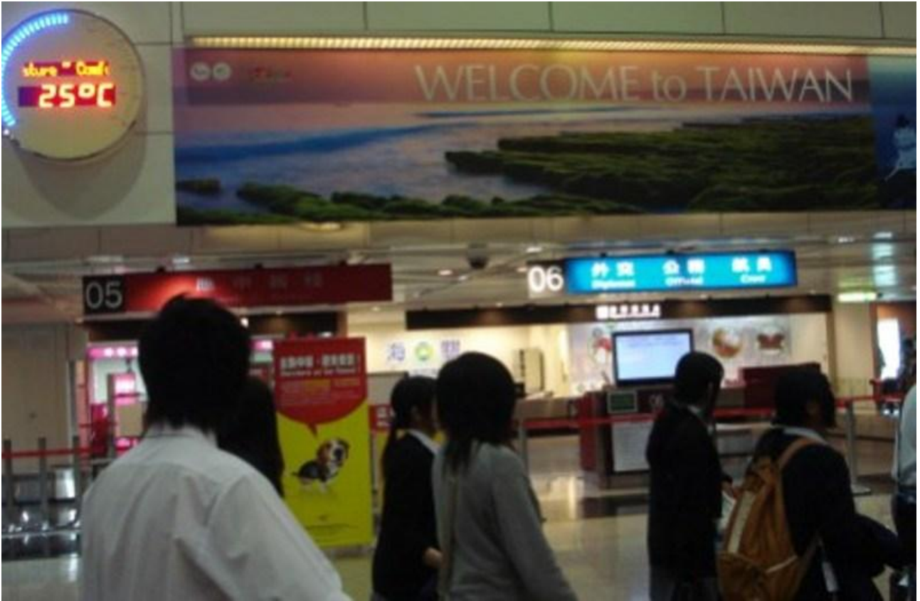
ホテルに向かう旅行隊