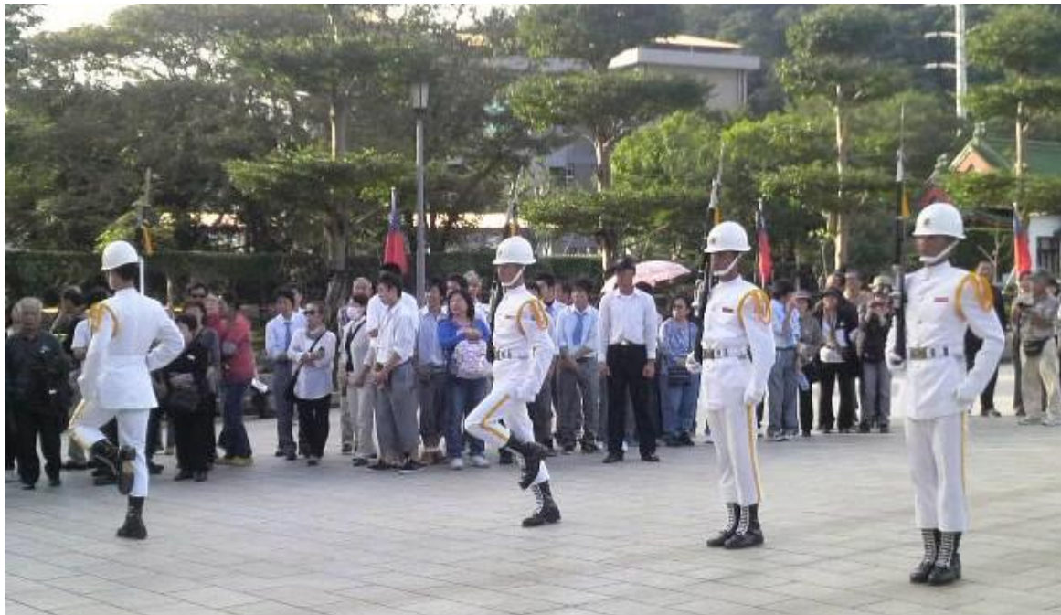
忠烈祠にて、衛兵の交代式を見守る生徒たち