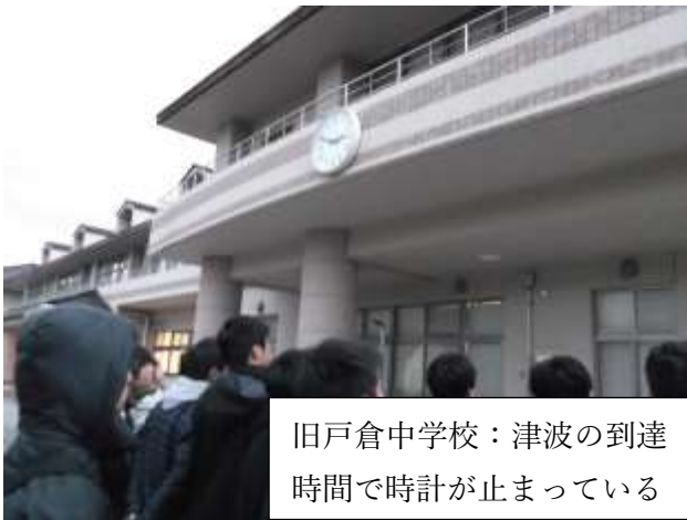
旧戸倉中学校：津波の到達 時間で時計が止まっている

2 学年が平成 29 年 11 月 15 日(水)から 17 日(金)にかけて東北地方に研修旅行へ行ってきました。1 日目は南三陸町へ行き、津波の浸水エリアや防災対策庁舎、旧戸倉中学校、さんさん商店街を見学し、震災講話を聞きました。2 日目はクラス別行動で、松島海岸のクルージングや中尊寺金色堂、東北大学などを見学しました。3 日目は班別行動で、東京・浅草周辺や横浜、東京ディズニーシーなど班ごとに計画し散策しました。