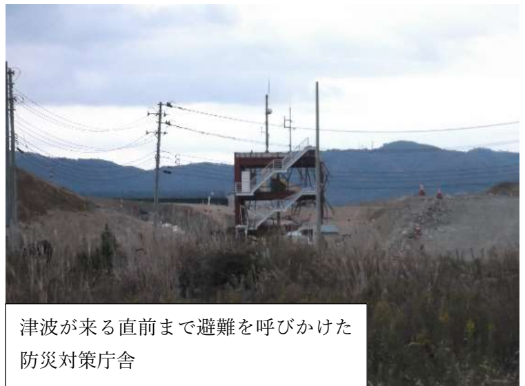
津波が来る直前まで避難を呼びかけた 防災対策庁舎