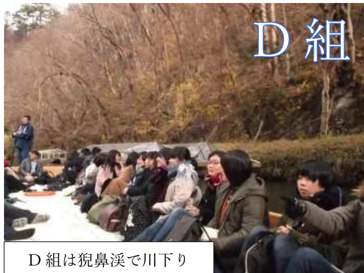
D組は狛鼻溪で川下り