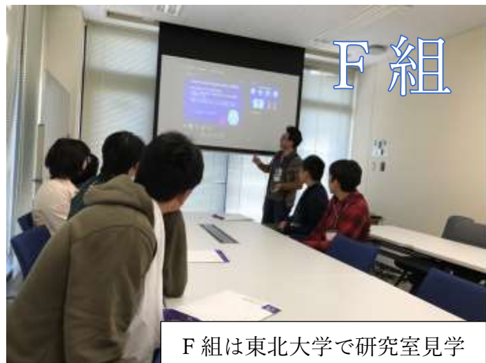
F組は東北大学で研究室見学