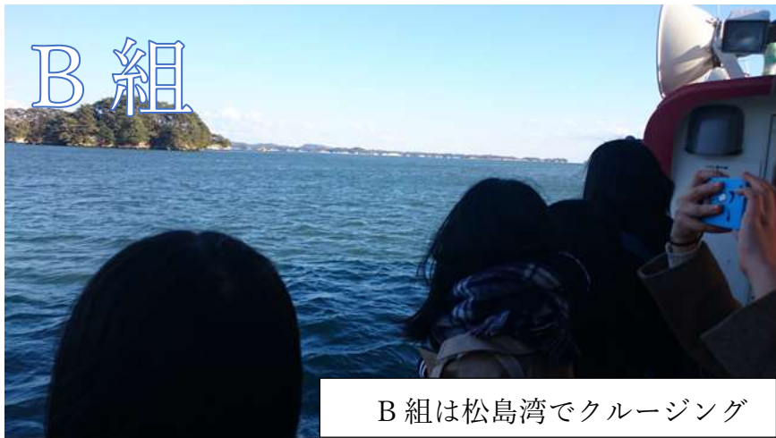
B組は松島湾でクルージング