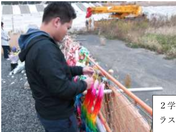
2 学年の生徒が折った千羽鶴を捧げ、ク ラスごと追悼式を行いました