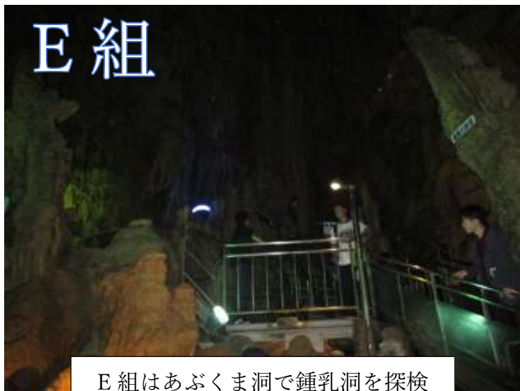
E組はあぶくま洞で鍾乳洞を探検