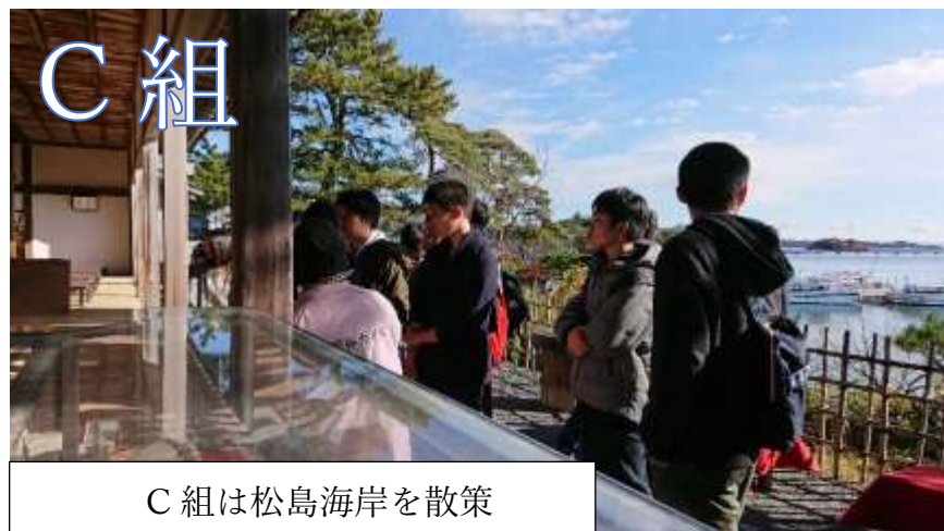
C組は松島海岸を散策