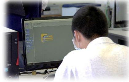
パソコンによるプログラミング