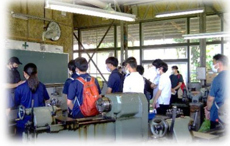
旋盤・溶接・フライス盤