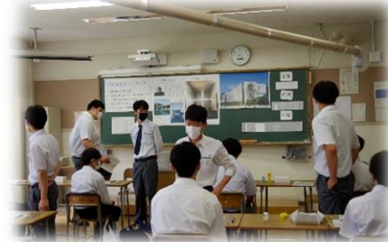
「光の教会」模型の製作