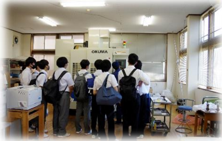
マシニングセンター見学