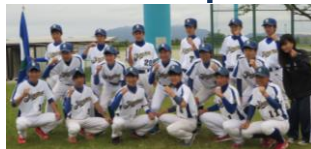
▲男子ソフトボール部

▲ソフトボール ■男子 ◆I部準決勝 ●1-2 日本文理(新潟) ◆第3代表決定戦 ●0-14 富山工 ◆第4代表決定戦 ○9-1 星稜(石川) ⇒ 全国総体へ