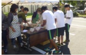
▲具だくさんで大人気の豚汁