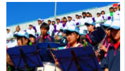
▲吹奏楽部による熱い応援(高岡商戦)