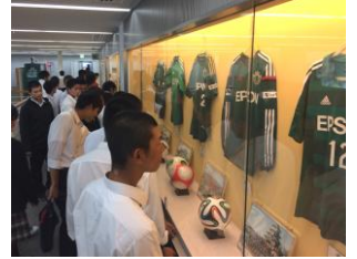
▲アルウィンの見学(スポ科)