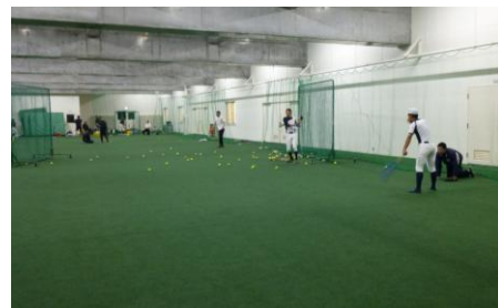
▲雨天時にピロティで練習に励む野球部

3月末に大体育館1階のピロティに人工芝が設置され、コンクリートむき出しだった床が一面グリーンに生まれ変わりました。同窓会・PTA・教育振興費から総額1000万円を支出していただき設置されたものです。本来ピロティは建物の1階を柱だけ残し吹き放しとする建築様式ですが、本校のピロティは外壁に囲まれており風雨をシャットアウトでき、今までも室内トレーニングルームとして利用してきました。設置された人工芝はオランダから取り寄せた多目的仕様(グランドホッケー用)のもので、下にラバーが装着されています。およそヨコ18m×タテ51mもの広さがあり、人工芝を張った室内練習場としては県内高校の中で最大規模のものとなりました。現在は、雨天時の体育の授業やスポーツ科学科の専攻授業、野球部等の室内練習場などに有効利用していますが、秋から冬にかけてはスキー部をはじめとして様々なクラブでの使用が見込まれています。